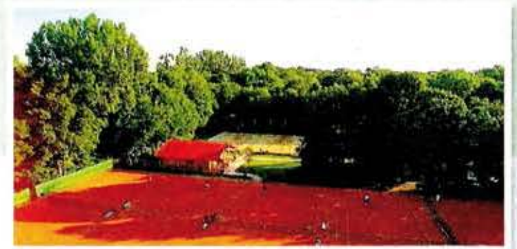
Grün-rote Idylle: Im Hirschgarten wird Tennis zum Naturerlebnis

6 MTC Ausstellungspark Der Tennisclub MTC Ausstellungspark am Grasweg 67 (Nähe Audi Dome) zählt zu den ältesten Tennisclubs in München. Täglich (Wochenende ausgenommen) sind bis 17 Uhr auf dem Gelände des altherwürdigen Tennisvereins mit seinen sechs hervorragend gepflegten Sandplätzen am Westpark auch Nicht-Mitglieder willkommen. Im Winter steht eine Traglufthalle zur Verfügung. Mehr Info: www.ausstellungspark.de